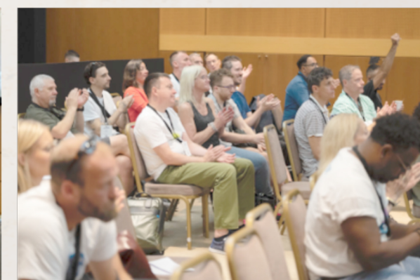
Public lors de la journée communautaire à la conférence INHSU à Athènes, en Grèce, en 2024

L'investissement, tant financier que sous forme de mentorat et d'accompagnement, dans le leadership des femmes qui consomment des drogues a non seulement le potentiel d'une croissance personnelle énorme, mais aussi d'une croissance communautaire. Le prix Jude Byrne Emerging Female Leadership Award est une bonne pratique pour encourager les femmes qui consomment des drogues à militer de manière à conduire à un changement transformateur. Pour mettre fin à la guerre contre la drogue, le monde a besoin de femmes fortes et bien équipées qui se sentent valorisées et soutenues dans le travail important et souvent invisible qu'elles accomplissent au sein de leurs communautés.